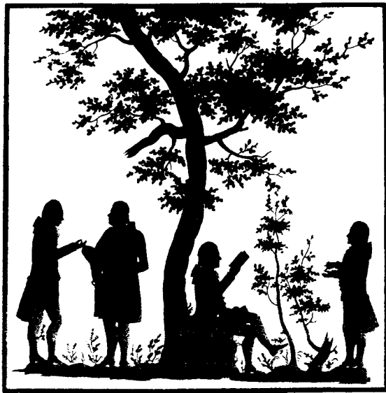
Так «функционировала» литература в русском обществе XVIII века: дворянская усадьба – аналог «московской кухни» двумя столетиями позднее. Еще не салон, но уже «неформальная коммуникация». Гравюра Н.В. Ильина. Из книги Шишко А. Каменных дел мастер. Повесть жизни архитектора Баженова. М: ГИХЛ. 1945.

Но есть и другой, более надежный показатель – данные по книгоизданию и библиотечному делу. В середине XVIII века в России имелось лишь два десятка типографий; в 1813 г. их было уже 66, в 1855 г. – 150, в 1864 г. – 276. Если в начале XVIII в. в год издавалось в среднем по 12 книг, то в начале XIX в. – уже по 150, в 1825 г. – 575, а в 1855 г. – 1020 на 119 названий больше, чем за всю первую половину XVIII века! В 1800–1855 гг. появилось 499 новых журналов, а за одно следующее пятилетие – еще целых 147. В середине XIX в. книжный рынок за год поглощал уже больше товара, чем за всю первую половину предшествовавшего столетия.