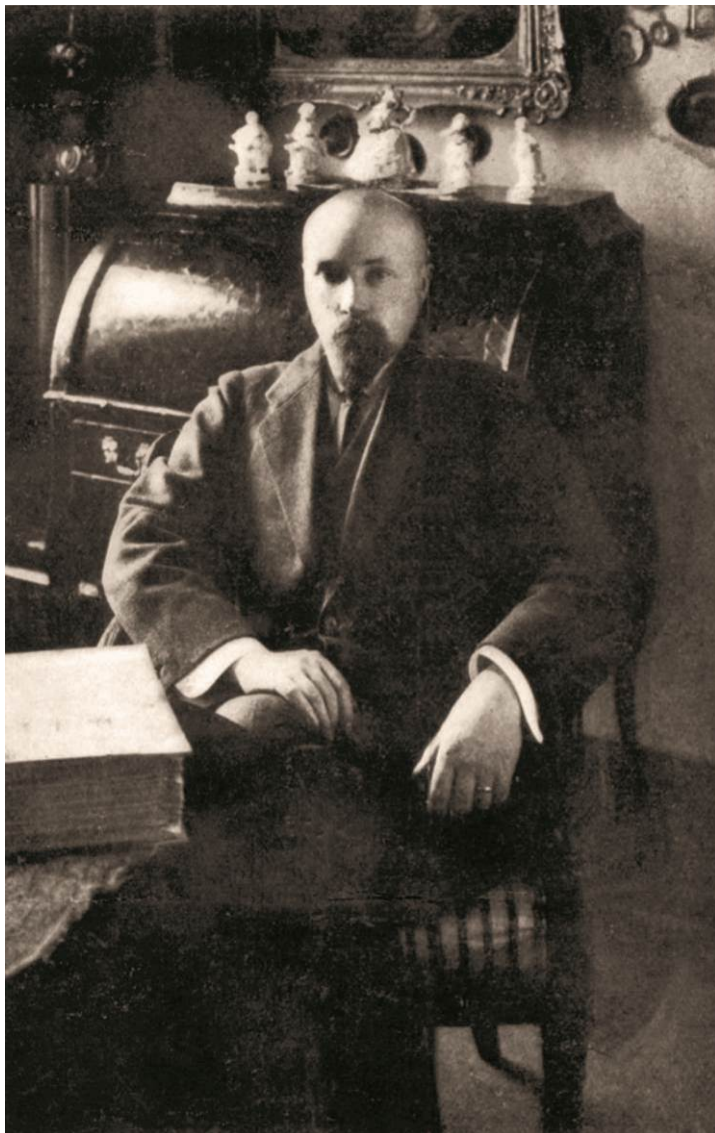
Н. К. Рерих среди собранных им художественных и научных коллекций Санкт-Петербург. Квартира на набережной реки Мойки, д. 83. 1910–1917 Собрание Музея Николая Рериха, Нью-Йорк