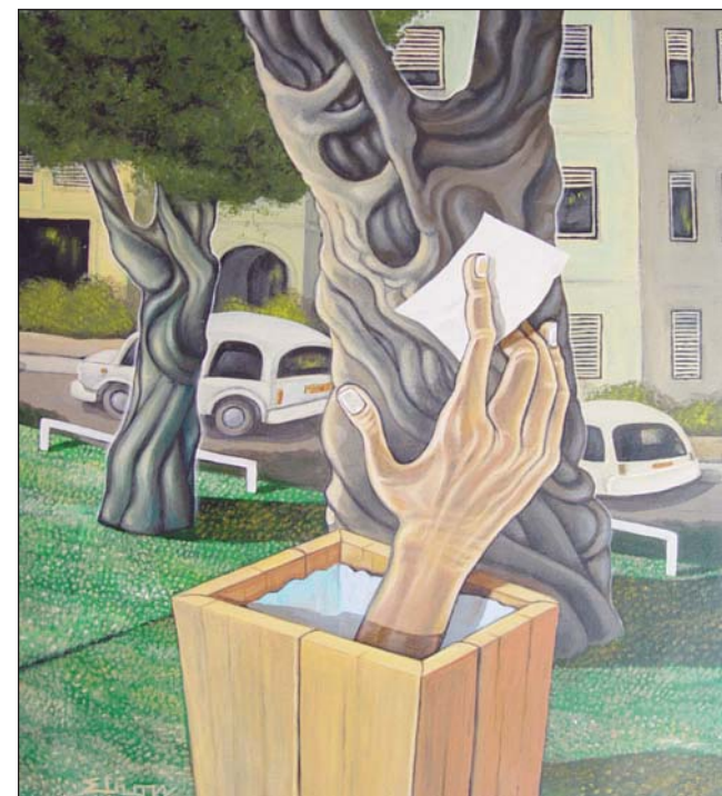
«Послание без ответа»