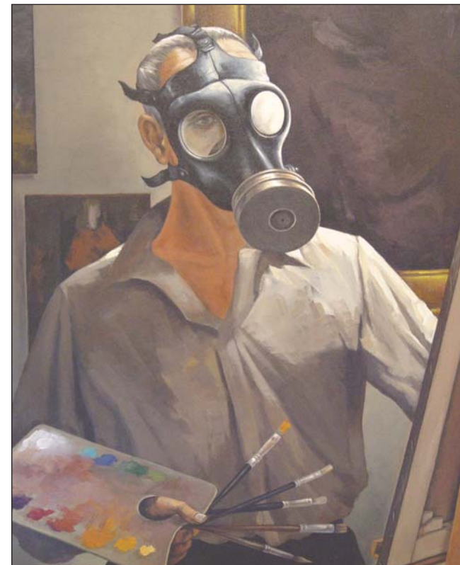
«Автопортрет в противогазе»

окружавший городской пейзаж становился точкой, от которой художник отталкивался, уводя своих зрителей в путешествие во времени и в пространстве.