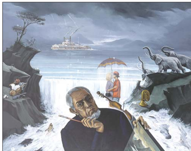
«Художник — Ной во время потопа»