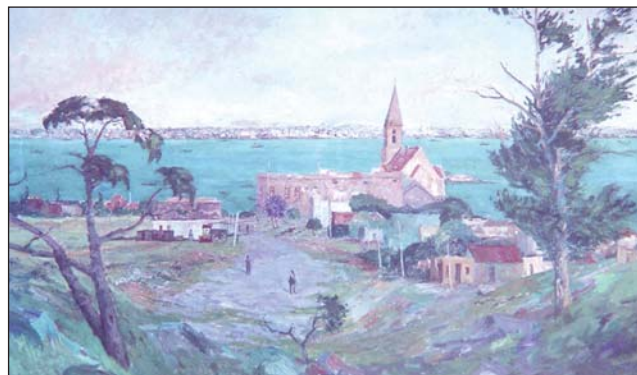
«Вид на залив Монтевидео с холма»