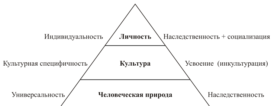
Рис. 2. Процесс ментального программирования личности в культуре

человека 60 . Основные темы, раскрытые в работах исследователя: проблемы взаимоотношения культуры и личности, типологии человеческого поведения и влияние культуры на формирование норм идеальной модели поведения индивида и культурные ценности. Таким образом, опосредованно К. Клакхон исследовал процесс формирования картины мира, в которой важнейшее значение имели ценности. Считается, что он одним из первых среди этнологов дал определение понятию «ценности» 61 . И хотя основной исследовательский интерес Ф. Клакхона касался интегрирующей роли ценности в культуре, но разработанный им вместе с коллегами инструментарий на долгое время стал основой для проведения различных кросс-культурных исследований на основании описания любой культуры по заданным параметрам.