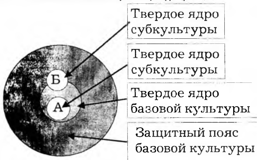
Рис. 2. Возможные соотношения между объемами твердого ядра субкультуры и объемами основных структурных элементов базовой культуры

Отметим, что вне зависимости от специфики субкультуры возможны два варианта отношений между объемом ее твердого ядра и объемами основных структурных элементов базовой культуры (рис. 2). В первом варианте объем твердого ядра субкультуры ограничивается обобщением некоторой части сакральных идеалов, составляющих объем твердого ядра базовой культуры (рис. 2; А). Во втором варианте, помимо этого, в твердом ядре субкультуры обобщены и сакрально-жизненные светские идеи, в своем изначальном виде являющиеся частью основной защитного пояса соответствующей культуры (рис. 2; Б).