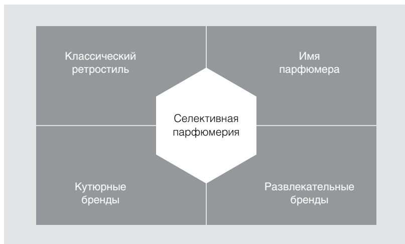
Ил. 2. Сегменты селективной парфюмерии на современном рынке

ра производителя является одной из самых древних и подразумевает большую долю личной ответственности за качество продукта. Сюда уместно включить такие компании, как Creed (основана в 1760 году), Houbigant (осн. в 1775), Lubin (осн. в 1798), E. Coudray (осн. в 1822), Guerlain (осн. в 1828), D'Orsay (осн. в 1830), Penhaligon's (осн. в 1870), Annick Goutal (осн. в 1981), NICOLAÏ, créateur de parfum (осн. в 1989), Lorenzo Villoresi (осн. в 1993), Jo Malone (осн. в 1994), M. Micallef (осн. в 1996), Keiko Mecheri (осн. в 1997), Serge Lutens (осн. в 2000), Miller Harris (осн. в 2000), Montale (осн. в 2003), Kilian (осн. в 2007).