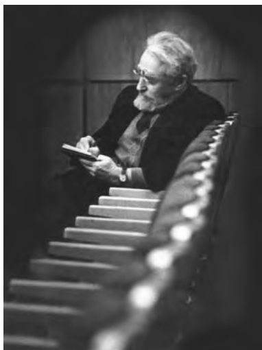
А. Д. Александров в 1980 г.