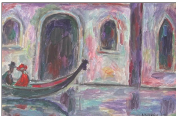
«Воспоминание о Венеции»