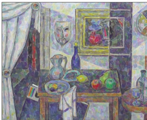
«Натюрморт с маской»

Именно так родилось и полотно «Скрипач»: на холсте изображен музыкант в кипе, со скрипкой и смычком в руках, на фоне распахнутого окна, за которым открывается вид на цветущие холмы, где то здесь, то там краснеют крыши домов поселений в Иудейской пустыне. Образ музыканта, его лицо, изящный корпус скрипки, пейзаж за окном — все это рождается и расцветает мириадами красок из тысяч мимолетных, почти ювелирных мазков, составляющих драгоценную живописную мозаику полотна. За окном, обрамленным текучими пятнами бордово-синих теней, живым оранжево-зеленым огнем расцветает вечерняя заря, обгаренная золотыми, лиловыми и алыми красками заката, которые мягко отражаются на изумрудно-салатовых склонах холмов, на белых стенах невысоких домов, согретых золотым светом — и эти красочные искры звенят в самом воздухе, бросая отсветы на скромное одеяние исполнителя, его лицо и руки, на яркие красно-оранжевые изгибы скрипки. Но музыкант не всматривается в исполненный красок пейзаж за спиной — его задумчивый и грустный взор направлен к зрителю, и в то же время — куда-то вдаль... Скрипка в его руках, сияющая оранжево-красным огнем, будто излучая свой собственный, внутренний, неудержимый живой свет, становится самым ярким источником цвета на полотне, споря с заходящим солнцем. Музыкант прижимает ее к сердцу, сообщая ей свое тепло, и именно она выражает его чувства и мысли тогда, когда он молчит, она уплотняется лире поэта — музыкальный инстру-