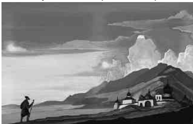
Странник Светлого Града. 1933. Темпера, холст. Из Нью-Йоркского музея Н.К.Рериха

Известная картина Николая Константиновича « Нодат Гее Наадегай Абааа » (1933) передаёт благоговейное, радостное ощущение, с которым каждый из Рерихов ходил по земле. Рериховские девизы — « Мир через Культуру », « Культура — почитание Света », « Из древних чудесных камней сложенные ступени грядущего » — не остались простыми декларациями, а вошли в жизнь многих народов.