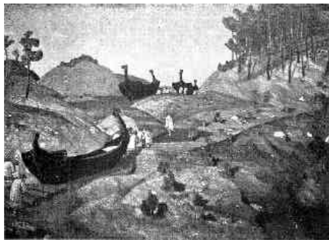
Рис. 2. Н.К.Рерих. Волокуч волоком. 1915. Темпера, картон. Москва, собрание Г.С.Торсуева

Отметим еще один момент в археологических исследованиях Рериха, в том числе и на Валдае. Условно их можно разделить на два периода. В первый период (1894–1903) художник-ученый регулярно получал открытые листы ИАК, дающие определенные права и полномочия в организации и производстве раскопок на землях «казенных, общественных и принадлежащих разным установлениям», то есть государственных. Но уже с 1904 года художник почти перестает обращаться в ИАК за открытыми листами 8 , что отнюдь не свидетельствует о прекращении им исследований. Напротив, во второй период (1904–