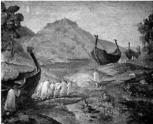
Рис. 1. Н.К.Рерих. Волокут волоком. 1915. Масло, холст. Музей Н.К.Рериха в Нью-Йорке

Поводом для написания этой статьи послужила выставка Н.К.Рериха, проходившая 8 апреля–3 мая 1997 года в Вышнем Волочке в помещении Центральной районной библиотеки 1 .