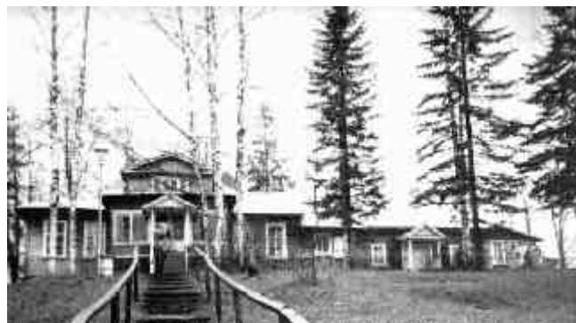
Академическая Дача. Музей и картинная галерея