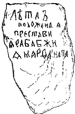
Намогильная плита Марфы Посадницы во Млёве

Следующим интересным местом вниз по течению Мсты, притом особо отмеченным Рерихом, было древнее Млёво. В очерке «Марфа Посадница» (1906) художник писал: