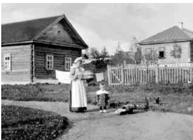
Юрий Рерих с няней в Берёзке. 1904–1905.